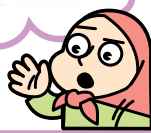
نماینده گروه سوم