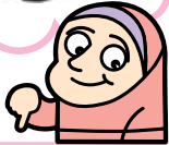
نماینده گروه چهارم